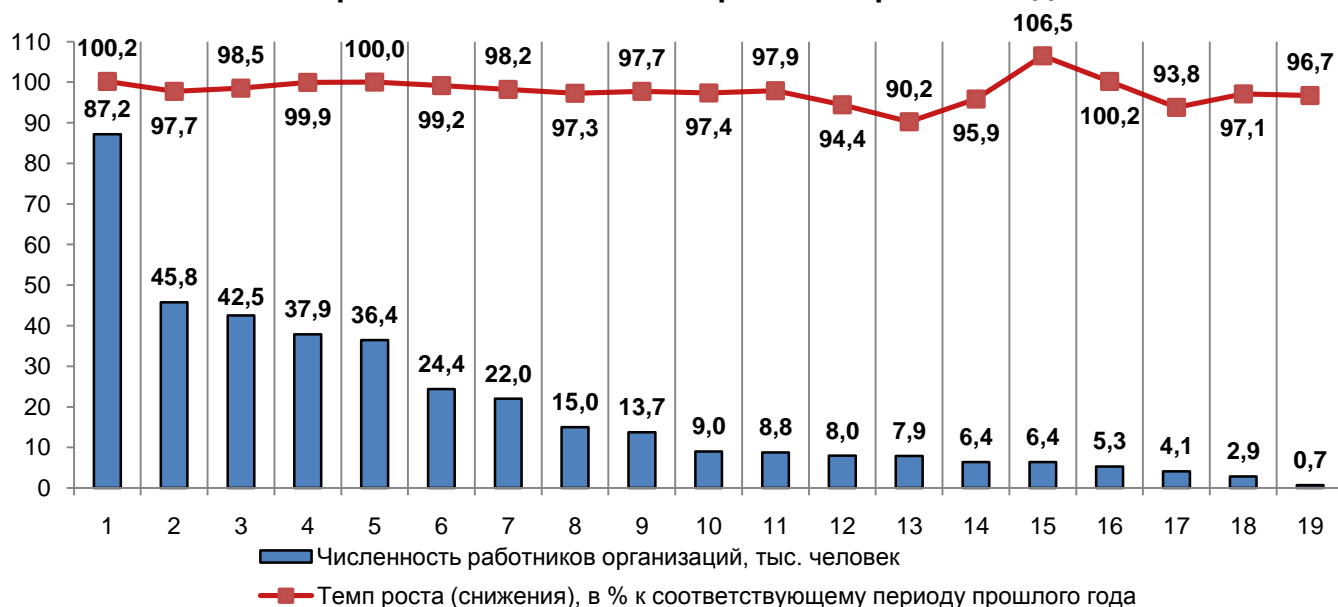
Среднесписочная численность работников организаций Кировской области в январе-сентябре 2018 года

По оперативным данным среднесписочная численность работников организаций нашей области за январь-сентябрь 2018 года составила 384,4 тыс. человек. Большая часть работников сосредоточена в сфере обрабатывающих производств - 22,7 % от общей численности работающих в организациях или 87,2 тыс. человек; образования – 11,9 % (45,8 тыс. человек); в оптовой и розничной торговле; ремонте автотранспортных средств и мотоциклов – 11,1 % (42,5 тыс. человек).